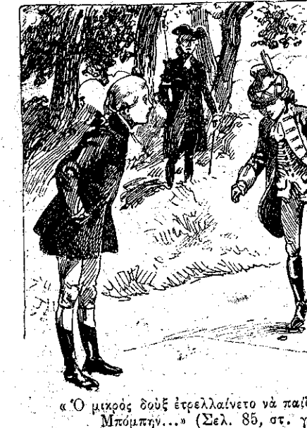
«Ό μικρός δούξ έτρέλλαινετο να παίξῃ με τον Μπόμπην...» (Σελ. 85, στ. γ.)