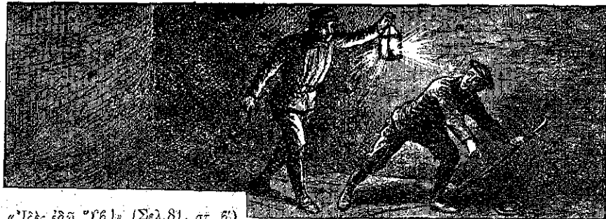
«Ἰδέ εἰδῶ, "Υβ!" (Σελ. 81, στ. 6)

λιν ἕνα τρίστρατον. Τρεῖς νέοι διάδρο- μοὶ ἤρχισαν, προχωροῦντες κατὰ τρεῖς διευθύνσεις διαφορετικὰς. Ἐνας δεξιᾶ, ἄλλος ἀριστερᾶ καὶ ὁ τρίτος κατ' εὐθείαν ἐμπρός.